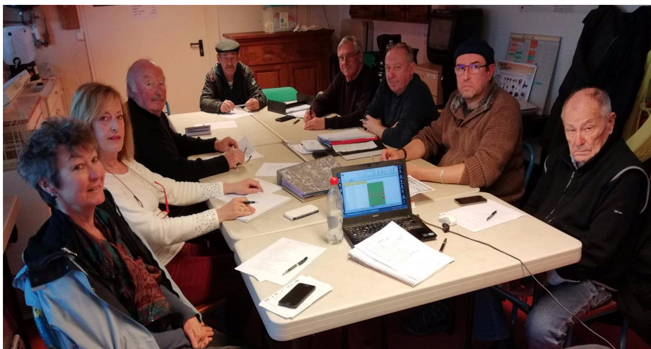
Les membres présents, très sérieux, au Conseil d'administration du 5 mars 2018