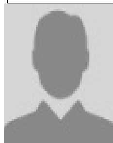
XXXXXXXX ( REPORTAGES)